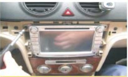
13 用4颗螺丝固定好CVD714朗逸主机