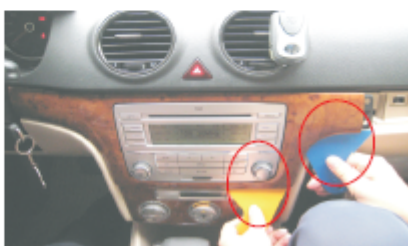
06 用专用撬板从右向左斜插入桃木面框, 将其面框右侧撬松