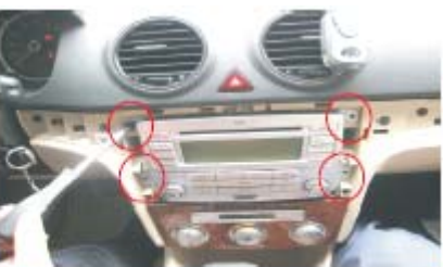
09 取掉固定原车主机的4颗螺丝