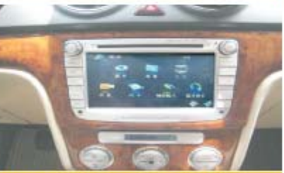
14 朗逸主机安装效果图