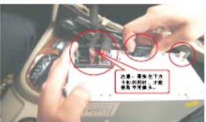
10 拔掉CD主机连接线及收音天线插头