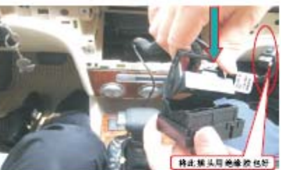
11 对插上朗逸专用连接线束、收音天线