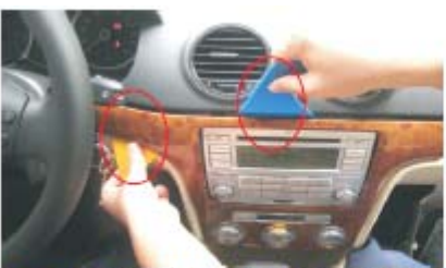
07 用专用撬板按图中标识方向分别插入桃木面框, 将其面框左侧和上端撬松