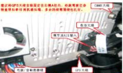
12 对插上朗逸专用连接线、收音天线、GPS天线、机后连接线束等