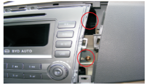
06 可见右侧两颗螺丝固定位