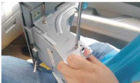
16 将原车右支架拆下来,装到本公司机器右侧上面(附件有配套螺丝)