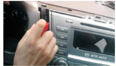
09 拆掉左侧两颗螺丝