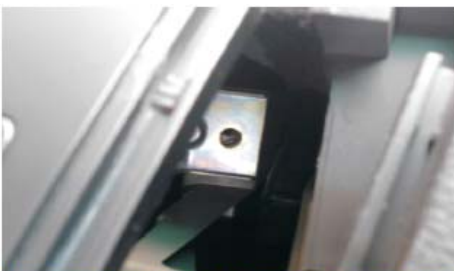
10 见图示检查左右上侧两颗螺丝为原车支架孔位与车身固定孔位是不是有错位现象，如有图示错位情况，请先扩支架孔位，然后再安装