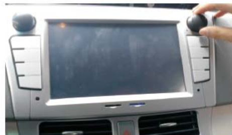
21 最后盖上左右装饰板,完成