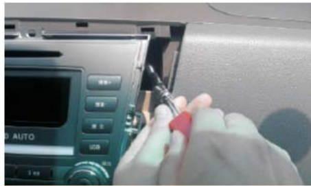
08 拆掉右侧两颗螺丝