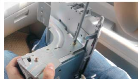
15 将原车左支架拆下来，装到本公司机器左侧上面