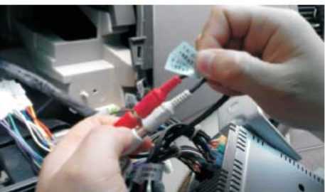
19 将原车音频输入线与本公司机器音频输入线相连接