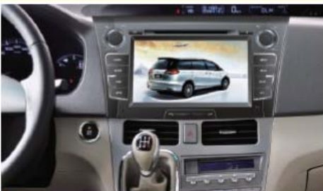
22 安装主机后的效果图