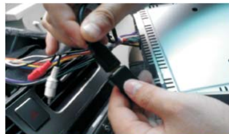
18 接原车USB线接口,插完后,用胶布缠绕防止松脱