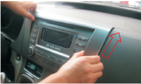
04 图示箭头位置扣松原车装饰板