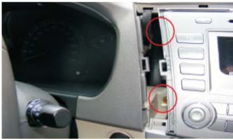
07 可见左侧两颗螺丝固定位