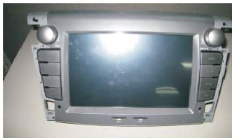
14 拆掉装饰板后的效果