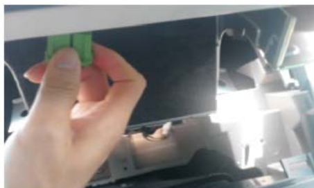
11 拔掉原车连接线材