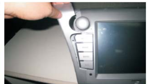
12 取出本公司机器，拆掉左侧装饰板