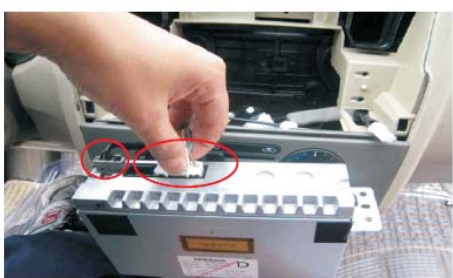
11 小心拔下原车主机电源数据连接线和收音机自动天线连接线