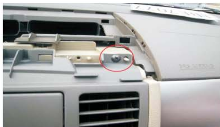
01 康泰壹响微果图面板固定螺丝