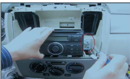
10 拆下原车主机固定螺丝 取出原车主机