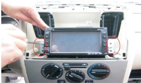
16 功能测试OK之后用螺丝将主机固定