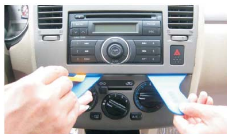
07 从空调控制器上方均匀用力撬松空调出风口面板