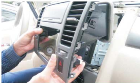
17 安装空调出风口面板 注意接上驻车灯连接线