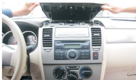
05 取下控制台上盖板