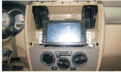
15 主机后面的连接线整理OK之后将主机装配到相应位置