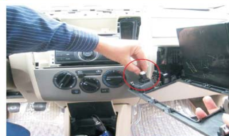
09 小心拔下驻车灯连接线