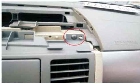
18 安装空调出风口面板固定螺丝