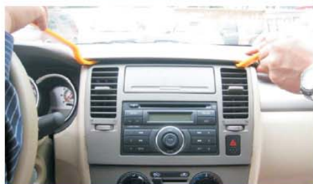
04 均匀用力撬松控制台上盖板 小心划伤控制台