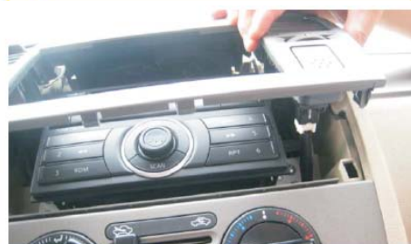
08 取下空调出风口面板 注意后面有驻车灯连接线