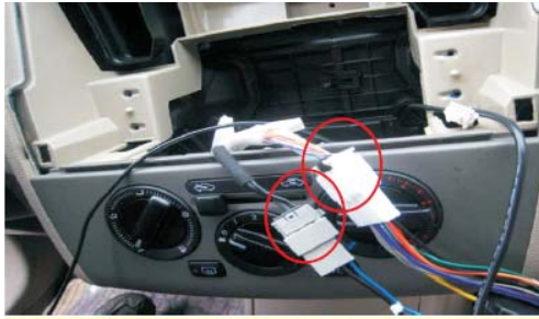
13 取出主机标配连接线与原车主机电源数据连接线和收音机自动天线连接线对接；固定安装支架（注意要使用原车装配螺丝）