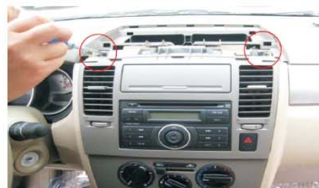
06 拆下空调出风口上方固定螺丝