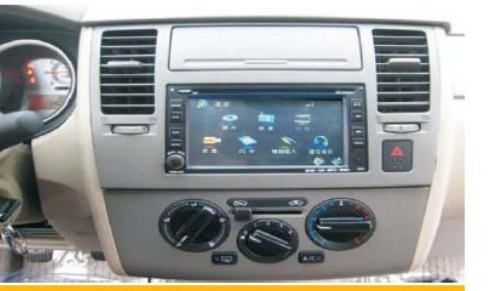
20 安装主机之后的效果图