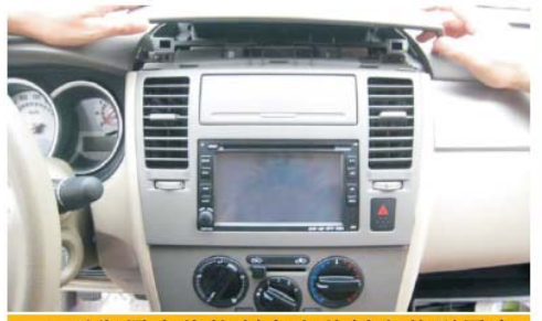
19 平衡用力将控制台上盖板安装到原来位置