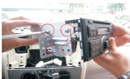
12 拆下原车主机安装支架