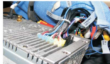
15 对插上主机电源/音响连接线、机尾连接线缆等;安装上主机定位柱