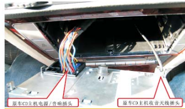
06 拔掉原车CD主机的电源插头和收音天线插头