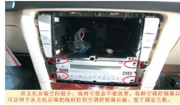
09 取掉空调控制器的4颗固定螺丝