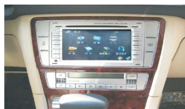
18 大众新领驭安装效果图