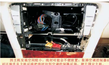
11 取掉装饰面框和空调控制器后的效果