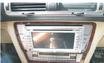
17 将空调控制器插头对接上并螺丝固定回原位;将装饰面框安装回原位