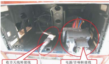
13 对插上大众新领驭专用转接线