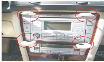
04 插上新领驭专用拆卸钥匙