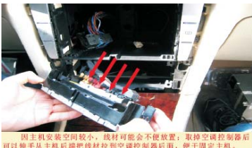
10 拔掉空调控制器后面的4个插头