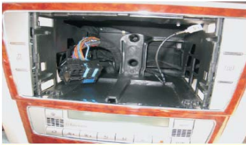
07 取掉原车CD主机后的效果