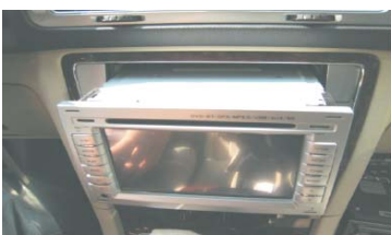
16 检查各连接线缆无误后,通电测试主机,将主机推入固定卡位