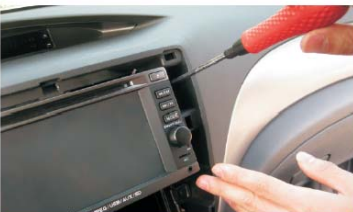
14 打紧固定DVD机的四个螺丝