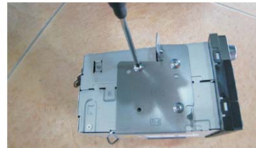
09 拆下CD机的左右安装支架