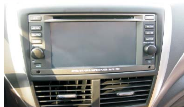
15 装上装饰盖板并压紧卡扣到位