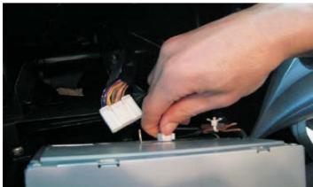
08 拔下电源插头和收音天线插头