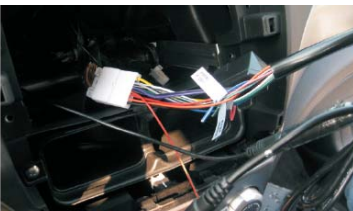
11 对插上电源线插头，方向控制线