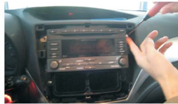
06 拆下固定CD机的四个螺丝