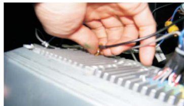
12 插上收音天线插头和GPS天线插头