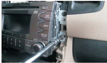
09 拆下固定CD机的四个螺丝