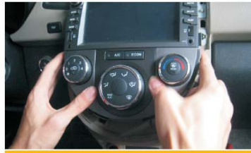
20 装上空调控制面板