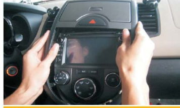
23 装上装饰盖板并压紧卡扣到位