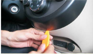
04 从下边开始撬开装饰盖板