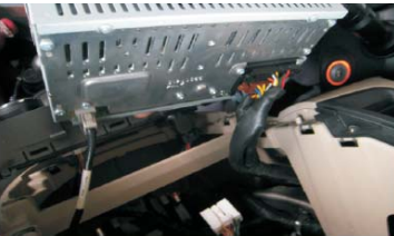
11 拔下电源插头和收音天线插头