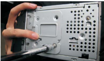
13 拆下CD右安装支架装在DVD导航上