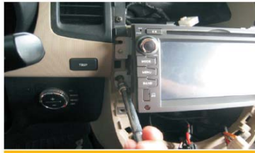
19 打紧固定DVD机的四个螺丝