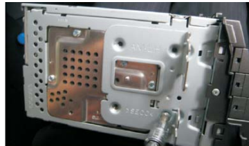
12 拆下CD左安装支架装在DVD导航上