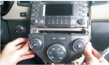
08 拆下空调控制面板