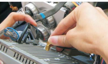
17 插上收音天线插头和GPS天线插头