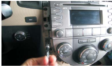
07 拆下空调控制面板的四个螺丝