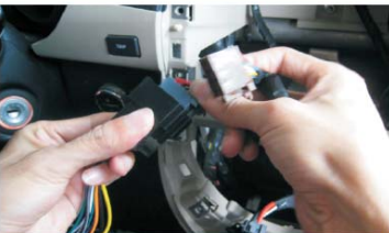
14 对插上电源线插头