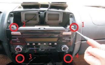
12 按图所示的顺序将螺丝拆下