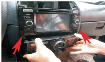
31 如图按箭头的方向将空调控制面板装好