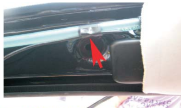
29 GPS天线按图示的位置贴上电工胶布固定