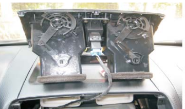
07 拆完后将空调装饰，如图所示放置在台面上