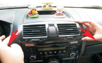
06 按照箭头的方向向外拖动