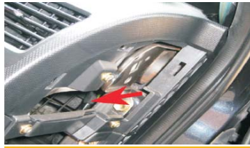
26 将GPS天线按照图示的位置穿过