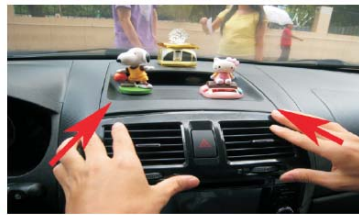
32 如图按箭头的方向将空调出风口装好