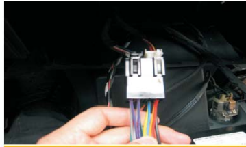
20 如图所示将连接线插好