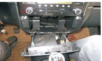
11 按如图所示，放置空调控制板