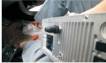
23 将固定橡胶柱按照如图装配到本公司的主机上