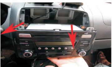
13 如图所示取出主机