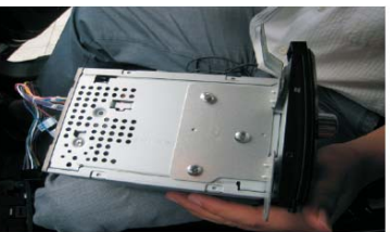
17 支架如图所示安装在我们的主机上