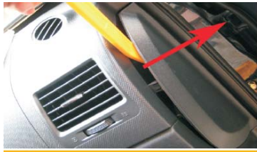
25 如图所示将侧板拆下