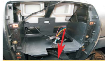
21 如图所示将我们的电源线穿到主机后面