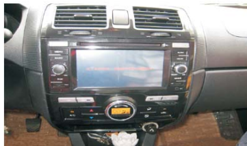
34 整车装配如图所示，至此你可以享受我们的产品给你带来的乐趣了