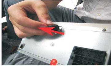
22 将原车上固定橡胶柱取下