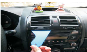
05 拆下空调出风口，按箭头方向用专业撬刀操作，撬动第二点