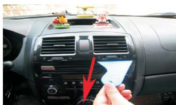
04 拆下空调出风口，按箭头方向用专业撬刀操作