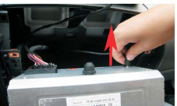
14 如图所示取出收音天线