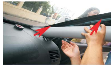
33 如图按箭头的方向将A柱由下到上扣到扣点上