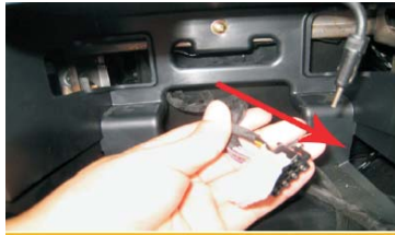
19 如图所示的位置穿出