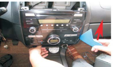
08 拆空调控制面板，按箭头方向撬动面板