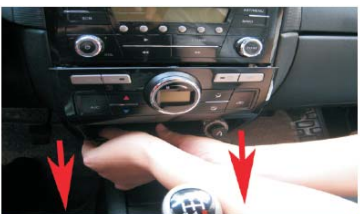
10 双手按箭头方向，向外拖动