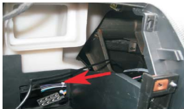
28 GPS天线按照如图的位置穿出