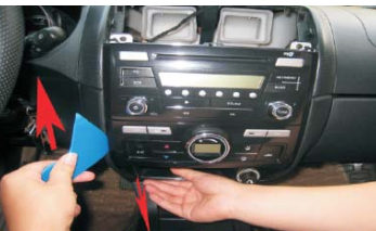
09 拆空调控制面板，按箭头方向撬动面板，第二点用另一只手向外拖动