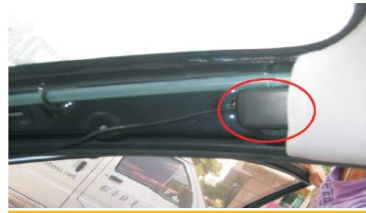
27 将GPS天线按照如图的位置固定