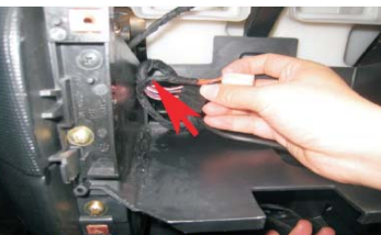
18 电源线束与功放线束按照图片的方法穿到主机的下方