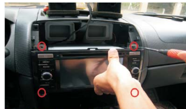
30 将线束插上，如图所示将主机的固定螺丝打上