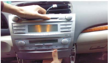
12 取下原车主机和空调控制面板 注意平衡用力并用毛巾保护档位手柄