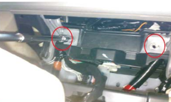
11 取下原车主机下方螺钉