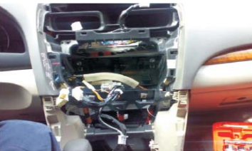
14 拆下原车主机之后的效果图