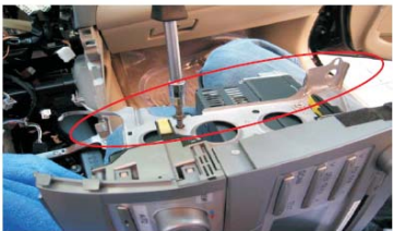
15 拆下原车主机安装支架