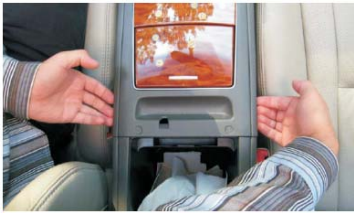
05 首先拆下变速档装饰盖