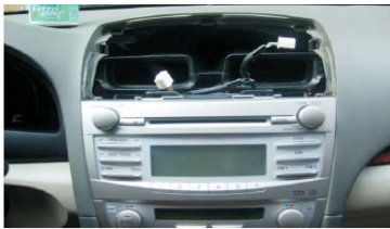
09 拆下空调出风口之后的效果图