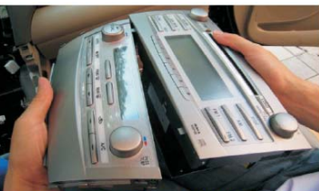
17 将空调控制器从原车主机拆下 安装到主机上