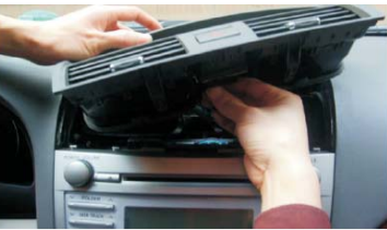
08 拔掉空调风口盖板后面的数据线