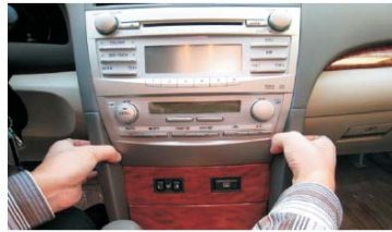
06 拆下变速档装饰盖 注意用力平衡