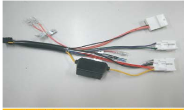
19 取出主机配置的连接线 可以看到已经设计好与原车匹配的接口