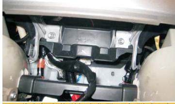
22 将主机安装到相应位置 开机测试OK之后用螺丝固定