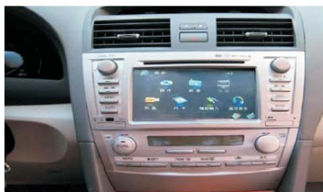
25 安装主机之后的效果图