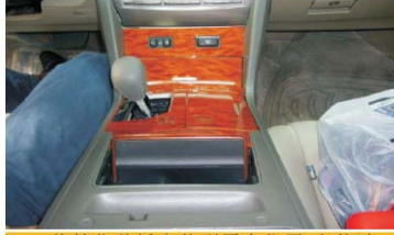
23 将档位盖板安装到原有位置 安装过程注意保护档位手柄