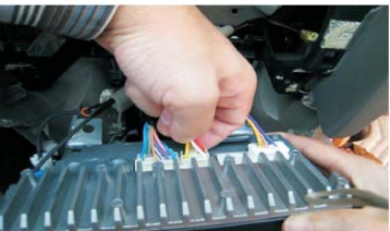
13 小心拔下原车主机连接线