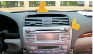
07 用胶刀拆下空调出风口