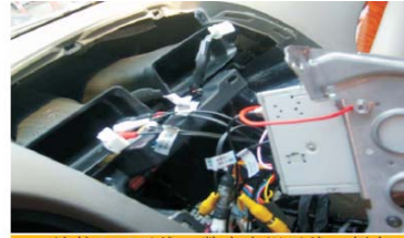
21 连接GPS天线、数字电视天线、倒车摄像头视频线