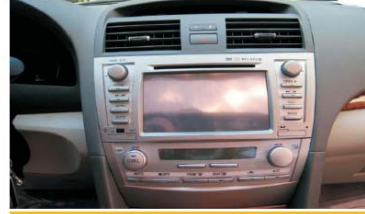
24 安装空调出风口盖板