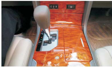
04 原车变速档装饰盖效果图