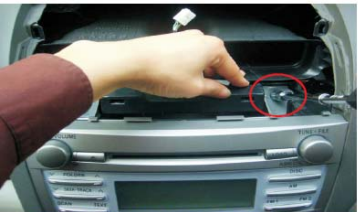
10 取下原车主机上方的固定螺丝 小心脱落