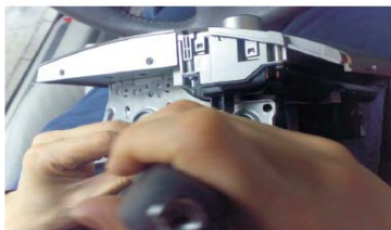
18 将原车安装支架装配到主机上