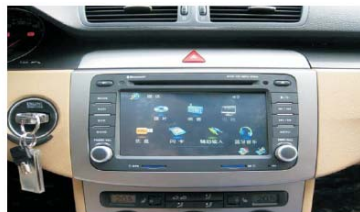
18 安装主机后的效果图