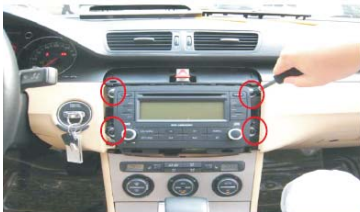
07 拆下原车主机固定螺丝