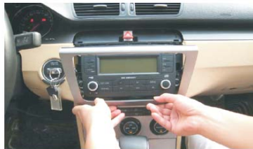
06 取下主机周围装饰板