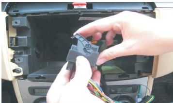
11 将主机与原车连接