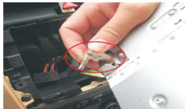
09 取下原车主机收音机自动天线