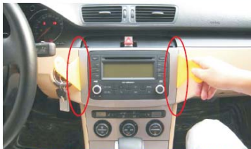
05 撬松主机周围装饰板 小心滑伤控制台