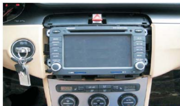
16 连接并整理好主机后面的数据线和电源线之后 将主机装配到相应位置，注意保护档位手柄；开机测试OK之后，用螺丝固定好主机