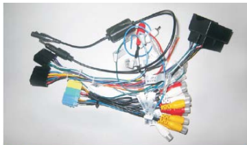
10 取出主机标配的连接线