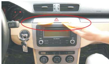
04 撬松并取下主机上方装饰盖板