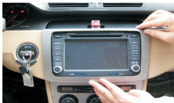
17 安装主机周围装饰板；安装主机上方装饰盖板