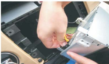
08 小心打开固定卡扣取下原车主机连接线 注意用毛巾保护档位手柄