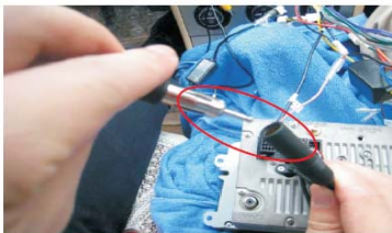
14 将收音机天线接到主机上