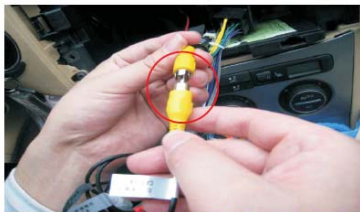
15 将已经整理好的倒车摄像头视频线接到主机上