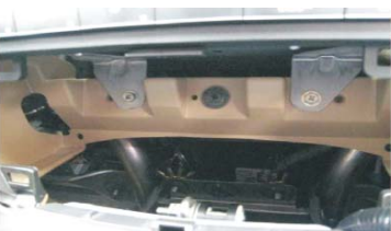
08 取下空调控制面板之后的效果图 可以看到原车音响主机的固定螺钉