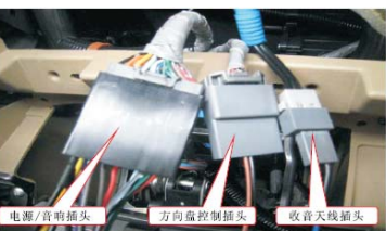
17 连接上已经走线OK的GPS天线和数字电视天线后，将车上的电源线和数据线连接到主机上，把USB线引到储物盒