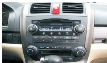
01 原车音响效果图 拆装过程中注意用毛巾保护好控制台面板和档位手柄