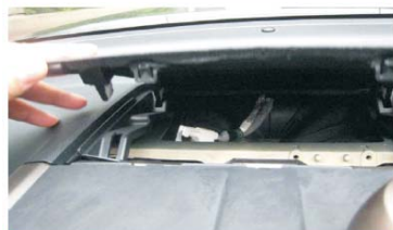
04 用胶刀翘起控制台盖板