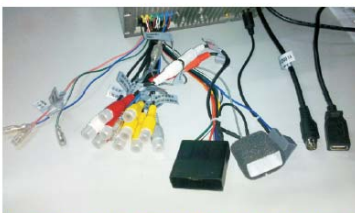
15 可以看到主机已经设计好与原车的匹配接口