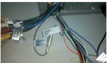
13 把电源线和AV线束的方控线接好