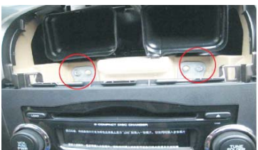
10 拆下原车音响主机上方的固定螺钉 取出原车主机 取出过程注意保护档位手柄