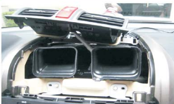
05 用胶刀翘出空调出风口 注意用力均匀