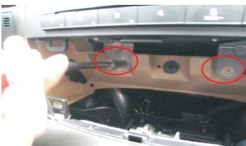
09 拆下主机固定螺丝 注意不要掉进控制台