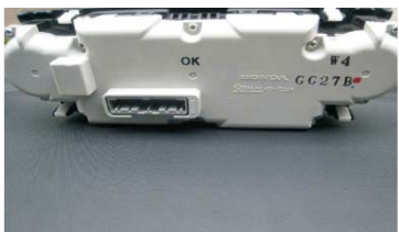
07 拔掉空调控制面板连接线 取下图示控制面板