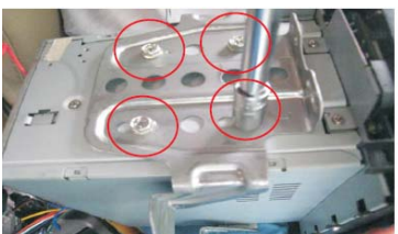
16 将已经从原车音响取下的专用固定架安装到主机上