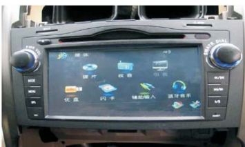
18 放入主机测试OK之后用螺丝将主机固定好