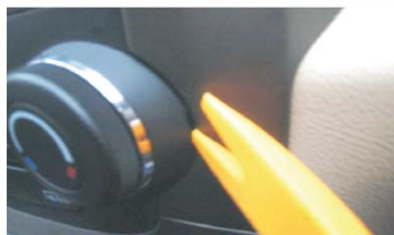
06 用专用胶刀翘出空调控制面板 注意对准图示凹槽 两边用力平衡