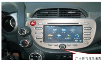
14 测试原车空调及主机的各项功能