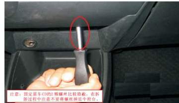
06 取掉CD主机下面的2颗支架固定螺丝