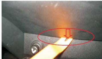
04 将档位挂至“S”或“1”档位, 按箭头方向从下向上撬开塑料盖板