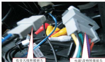
11 将新飞度专用尾线与原车对插