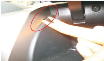
08 打开杂物盒, 从预留的小孔撬起面板