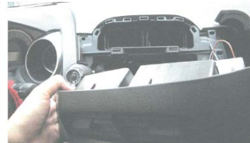
09 取出原车CD主机, 拔掉主机后面的插头