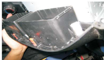
10 将原车CD上面的空调出风口及应急灯开关取下, 固定在新飞度专用主机上