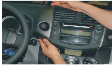
06 拆下左侧板，并拔下接线