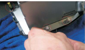
13 把原车CD机上的扣子取下装到DVD导航机上