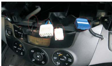
15 把导航天线在车上装好后，把转接头引到中控位，和DVD导航机对接好后，再把上图的三个查头和转接线对接，然后再把收音天线接到DVD导航机上