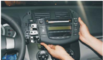
09 拔出主机，注意拆下和出风口扣位；拔下尾部连接线