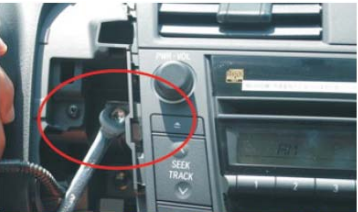
07 用套筒或扳手拆下左侧固定支架的两螺丝