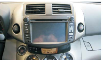
18 DVD导航装配好之后的效果图