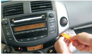
04 用毛巾把换挡手柄盖好，以防止刮花，用胶刀把主机右侧板拆下