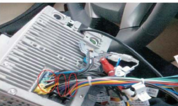
14 把DVD导航机包装附件的的转接线装到DVD导航机上