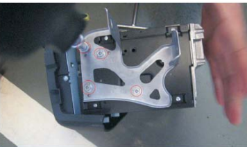
11 把原车主机上两侧的支架拆下来