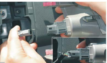
17 装好主机固定螺丝后，再把两侧边装饰板装好，注意要对接插头