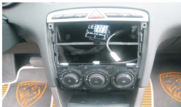
11 拔下后端尾线后效果图