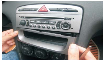
08 取下储物盒装饰面壳, 注意内部卡扣