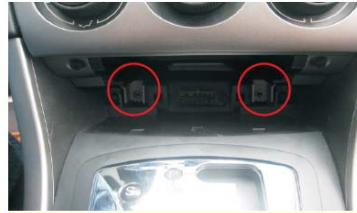
06 拆掉空调面板下面的两个固定螺钉