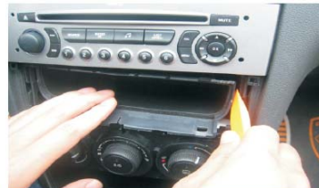
09 取下储物盒, 注意两侧的卡口