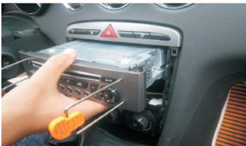
10 使用专用拆车钥匙拆下CD主机