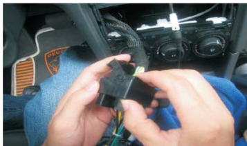
14 将电源线与原车电源线插头连接