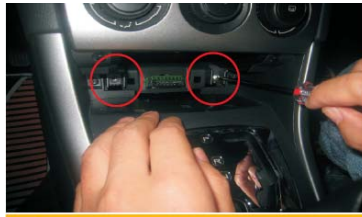
19 固定好空调面板下端的两颗固定螺钉