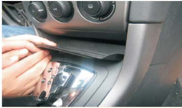
04 取下烟灰盒下面的软橡胶垫