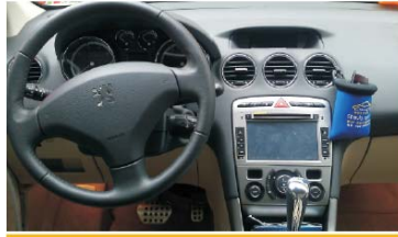
22 导航装配完毕后效果