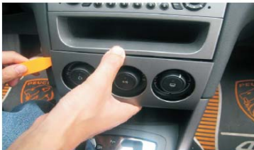
07 用撬刀撬松并取下空调面板