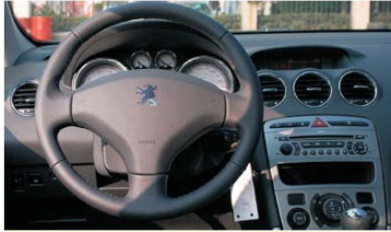
01 安装专用导航前效果