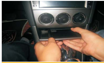
20 将烟灰盒放回原位