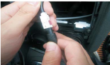
13 将天线转接线与原车天线连接