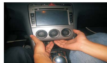
18 将空调面板装回原位