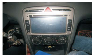
17 整理好后端尾线, 将主机安装到位