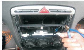
12 用剪钳剪除中间横骨