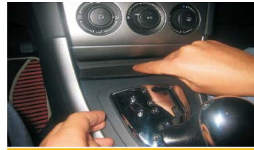
21 将软橡胶垫放回原位