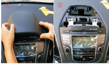
05 用手向外拉起并取出