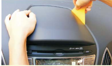
04 用塑胶刀撬松原车CD主机的盖板