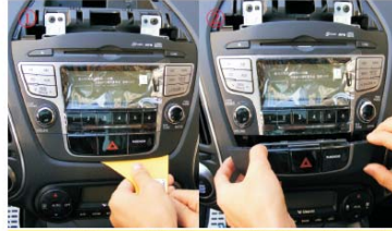
06 用塑胶刀撬松警示按键面板，并用手取出