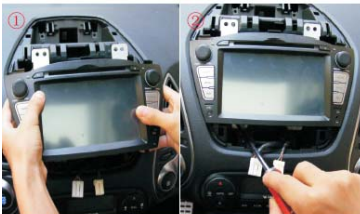
10 装好主机并固定好四颗螺丝