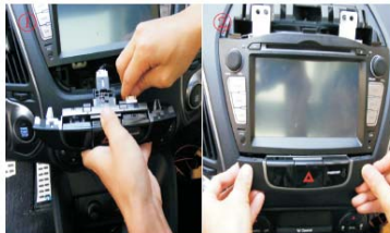
11 警示开关面板接回线，并装回原位