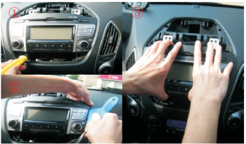
08 拆卸CD主机的4颗固定螺丝，用胶刀撬松后取下