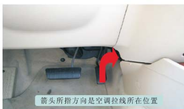
14 驾驶员位空调拉线所在位置 箭头所指方向是空调拉线所在位置