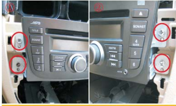
22 拆掉原车CD主机的4颗固定螺丝