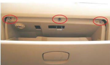
10 取掉储物箱上方的3颗固定螺丝