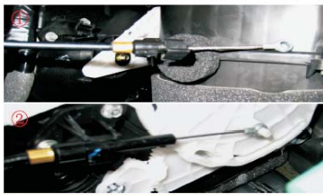
33 将空调拉线固定到原来的位置