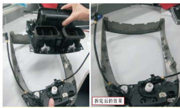
26 拆下原车大面框上的储物盒部件