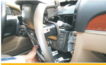
19 向外拉出银色装饰面框