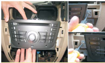
30 把主机固定在卡位，打紧螺丝固定。