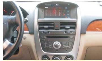
35 别克新凯越安装效果图