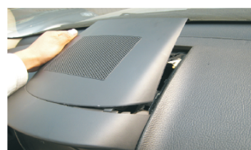
06 从塑料上盖后端提起，取掉塑料上盖