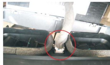
18 拔掉应急灯开关插头