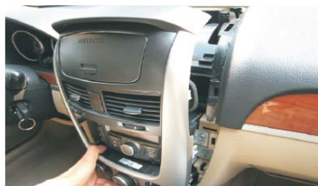
17 向外拉出银色装饰面框