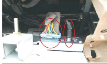
24 拔掉原车CD主机的电源/音响插头 收音天线插头