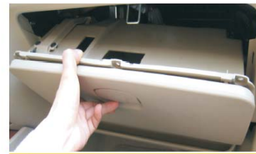
34 安装储物箱，对应固定5颗螺丝