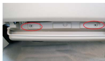
09 取掉储物箱下方的2颗固定螺丝