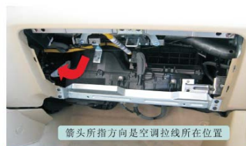
12 取出储物箱后的效果 箭头所指方向是空调拉线所在位置