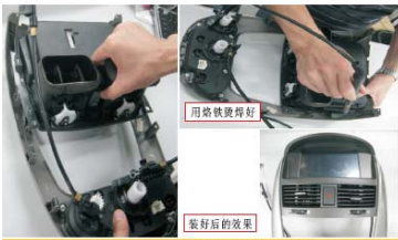
28 把专用导航显示面板装在原车大面框 里并焊接好