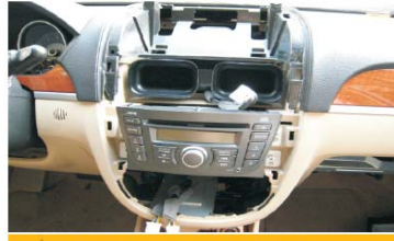
21 取掉银色装饰面框后的效果