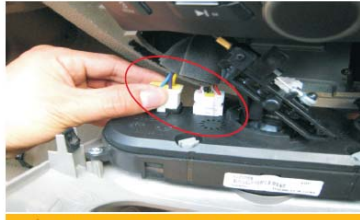
20 拔掉空调控制器2个插头