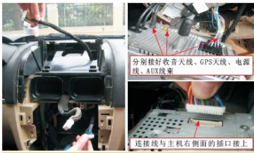
29 布好主机与显示连接线，开始安装 专用导航主机：