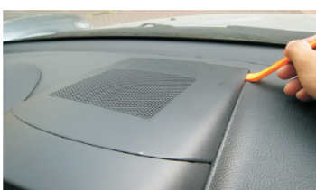
04 从塑料上盖后端右边开始撬起