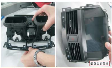
27 把储物盒部件中的空调出风口拆下， 并装在专用导航显示面板上。