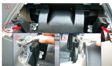
08 取掉银色装饰面框的2颗固定颗丝