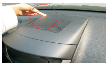
05 撬松塑料上盖后端左边