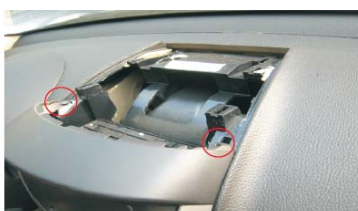
07 取掉塑料上盖后的效果