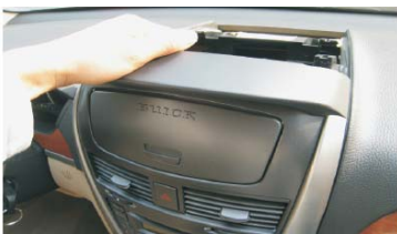
16 向外拉出银色装饰面框