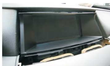
44 将原车卡扣拆下后装到面框上按图示方法安装