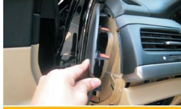
23 用胶刀撬开方向盘左边塑胶盖