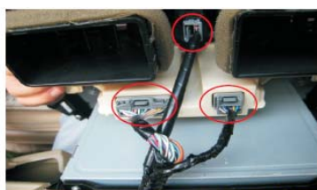
48 将图示处三插头插入原车空调控制盒插座