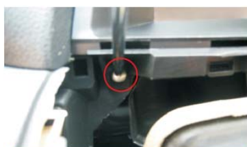
46 固定面框左边螺丝