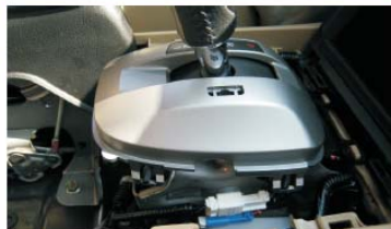
15 拆开档位塑胶盖,并将档位换到D档