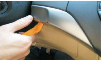
08 用胶刀撬开CD主机左边银色装饰条