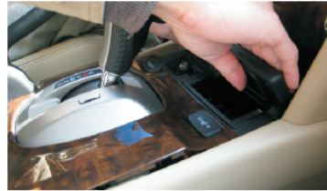
06 双手握住烟灰缸盖板撬开桃木前部分