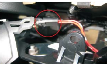
17 拆掉图示处插座线