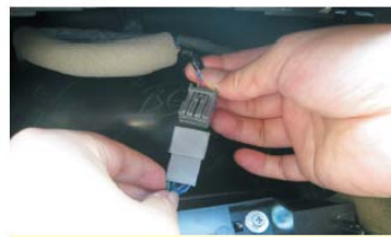
32 将我司屏转接线同原车屏插头对接