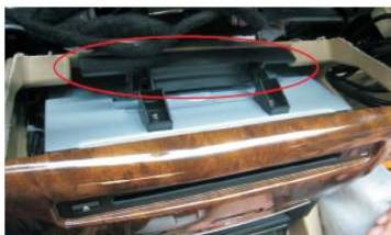
38 将支架用螺丝固定到图示处位置，将主机后方线材整理好