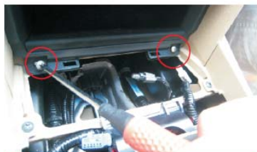
40 固定票盒下方两螺丝安装好