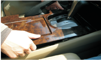
05 双手撬开档位桃木