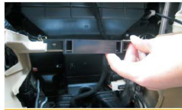
29 将下方安装支架对准原车孔位安装