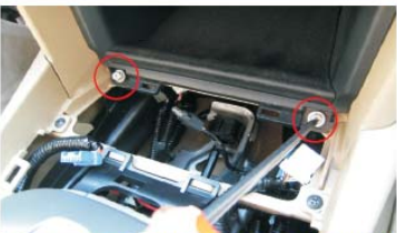
13 用十字螺丝刀拆下票盒下边左右两螺丝