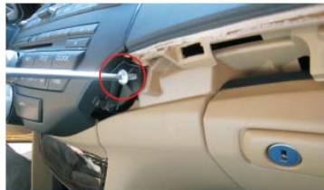
12 用十字螺丝刀拆下CD主机右边螺丝