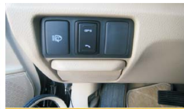
27 将方向盘左边塑胶盖和左侧塑胶盖还原