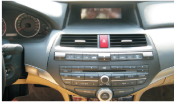
01 原车CD主机和显示屏效果图