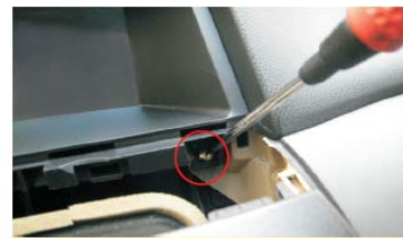
45 固定面框右边螺丝