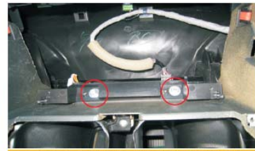
30 将上方安装支架对准孔位后用图示处两螺钉固定