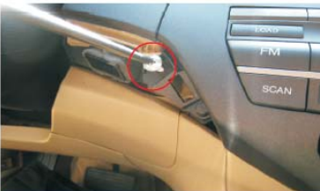
11 用十字螺丝刀拆下CD主机左边螺丝