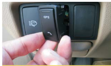
25 将GPS和蓝牙快捷键装入中间孔位