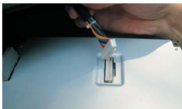
41 将屏排线和屏面板插座对接