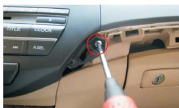
51 固定原车CD主机左右螺钉