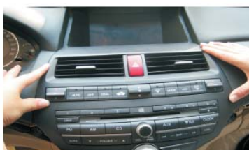
50 整理好线材后将原车CD主机安装好