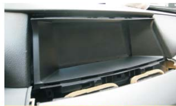
44 将原车卡扣拆下后装到面框上按图示方法安装