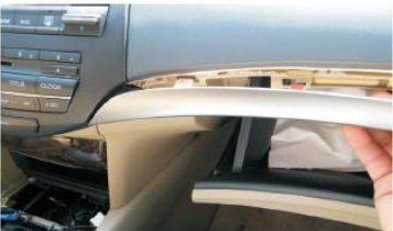
10 拆下右边银色装饰条