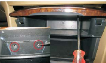
14 拆下票盒里面上方两螺丝