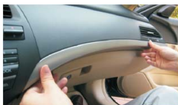
52 将右装饰条安装好