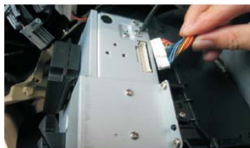
37 将屏转接线插头插入DVD主机右侧插座