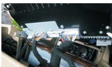
47 将我司电源转接线插入原车CD主机插座