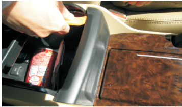
04 撬开储物盒前端黑色塑胶盖