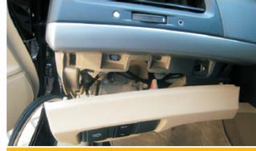
24 用胶刀撬开方向盘左边塑胶盖