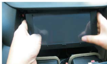
42 把屏面板按图对准孔位安装好