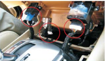
07 拔掉图示处四插座