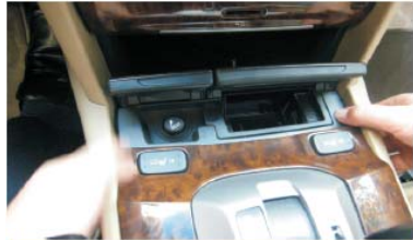
55 固定好桃木装饰件，将档位还原到P档