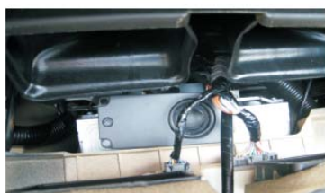
49 将我司中置喇叭贴到原车主机上方