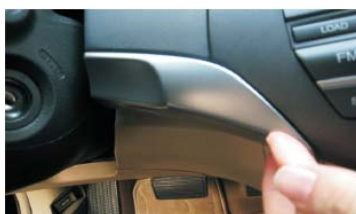
53 将左装饰条安装好