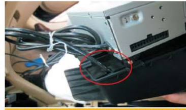
21 打螺丝之前一定要把USB甩线穿过票盒后方孔位