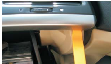
09 用胶刀撬开CD主机右边银色装饰条