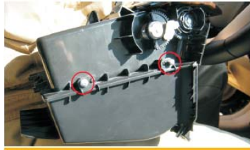
19 用十字螺丝刀拆下图示处两螺丝