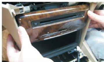
39 将主机卡扣对准支架孔位慢慢推入，装到图示位置