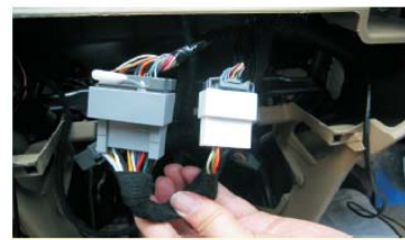
33 将我司电源转接线同原车插头对接