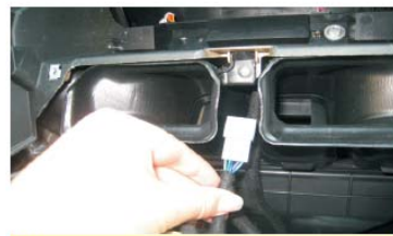
31 将我司屏转接线穿过空调出风孔下方