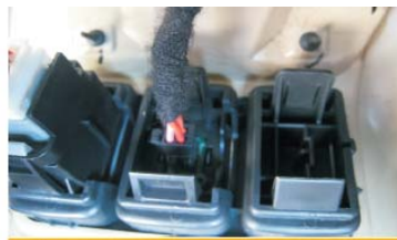
26 把插头插入快捷键背面插座