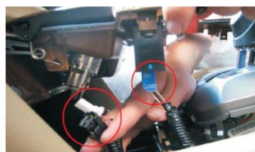
54 将桃木前方点烟器下方插座安装好