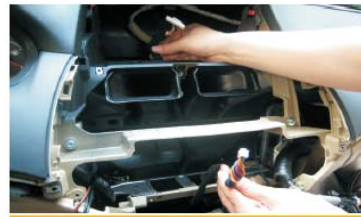
28 将屏电源线穿过空调出风孔下方