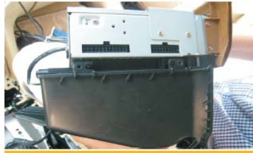
20 将DVD主机装到票盒上