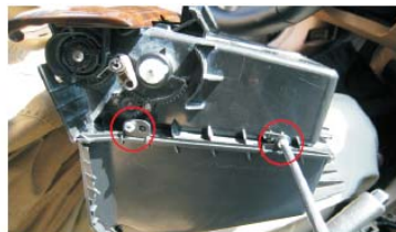
18 用十字螺丝刀拆下图示处两螺丝