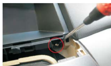
45 固定面框右边螺丝