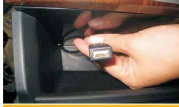
22 USB母座放置在图示票盒里