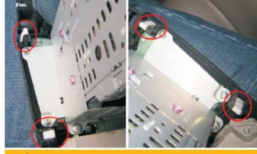
23 取下CD机上的扣子，装到DVD导航机上