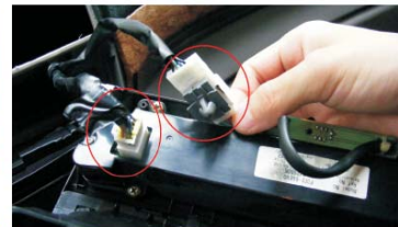
12 拔下显示屏和停车警示按键的插头