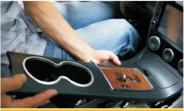
28 装配好护板盖、并接好线