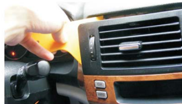
11 用胶刀取下出风口和显示屏