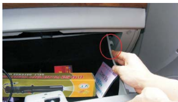
17 按住扣子取下储物箱