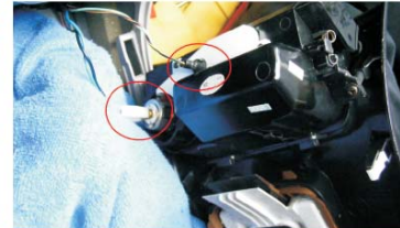
09 先盖上毛巾保护后, 再把两个插头拔出