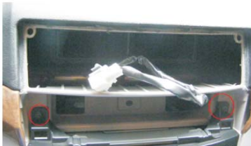
13 取下CD机上侧的两螺丝