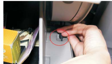
15 取下副驾驶位储物箱的挂杆