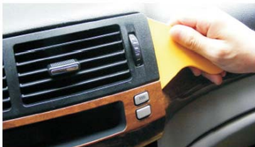
10 用胶刀取下出风口和显示屏