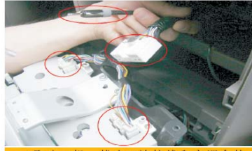
20 取出CD机，拔出CD连接线和空调盒的连接线