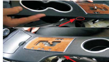
08 取下两个背光灯插头(旋转取出)