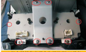
22 把金属板和空调盒取下装到DVD导航机上