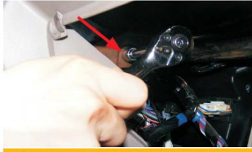
19 取下储物箱位固定CD机后侧的螺丝