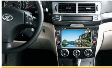
30 安装主机后的效果图