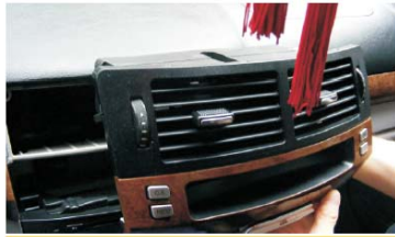
27 把出风口和小屏接好线后，装配好