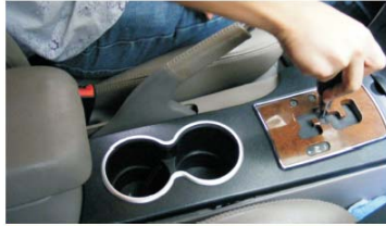
04 把档位往后调, 以方便拆装