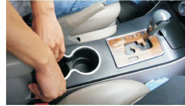
06 从后侧提出护板盖