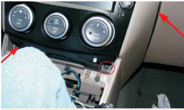
26 固定好尾部储物箱侧的螺丝后，把储物箱装好，再固定下侧两螺丝