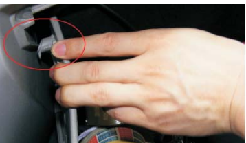
16 按住扣子取下储物箱