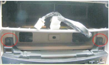
25 对接好空调线后，把DVD导航机装到车上（注意理好尾线），固定上侧两个螺丝