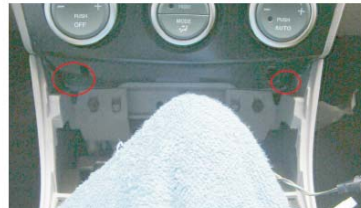
14 取下CD机下侧的两螺丝