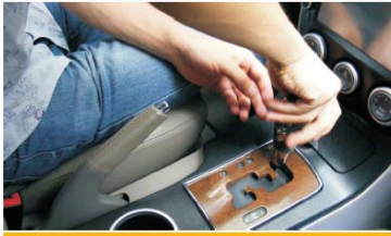
29 装好手柄，拨到空档，完成改装