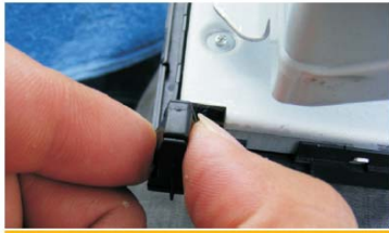
19 取下CD面板背面的卡扣