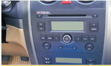
01 原车中控台面板效果图