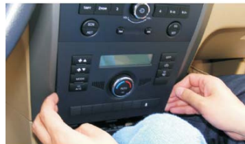
11 撬开空调控制面板的两侧