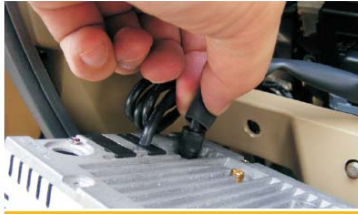
22 插上本机尾部的线束