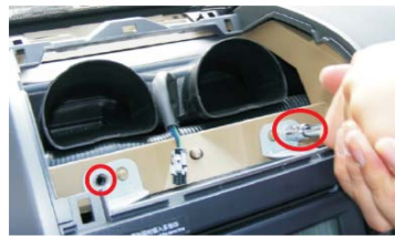
14 拧下CD面板上侧的螺钉