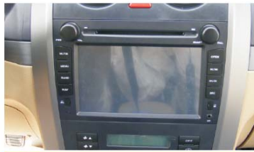
31 装好本机后的效果图