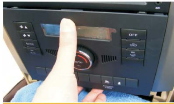
28 装入空调控制面板