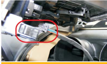
26 插入空调出风面板的线束，再装入车内