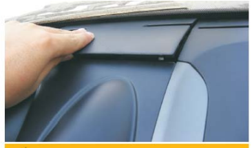
27 装入空调出风口上部的盖板