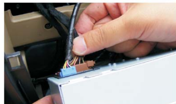
16 拔出CD机左侧的线束