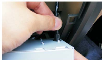
17 拔出CD机右侧的天线