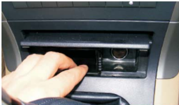
07 取出点烟器左边的储物盒