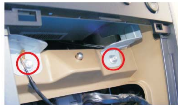
13 拧下CD面板下侧的螺钉