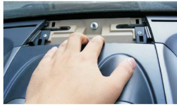
05 用手向后拉开空调出风口的面板