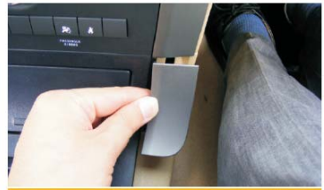
30 压入储物盒两侧的装饰片