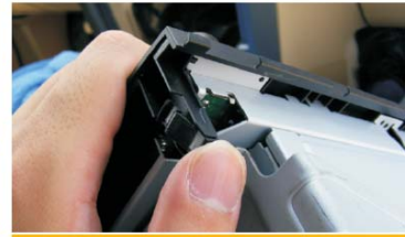
21 将原车面板的卡扣压入本机面板