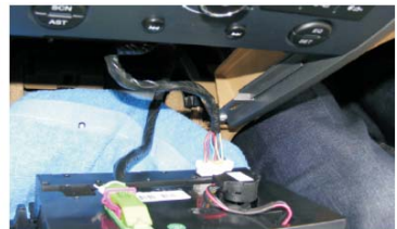
12 取出空调控制面板, 放在毛毯上