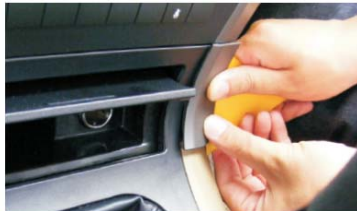
08 撬开点烟器两边的装饰片