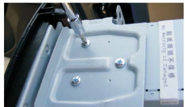
18 取下CD机箱两侧的安装支架