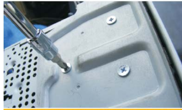
20 用附件盒的螺钉，将原车安装支架固定在本机上