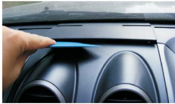
04 用胶刀撬开空调出风口上部的盖板