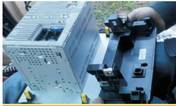
19 把空调盒装到DVD导航机上