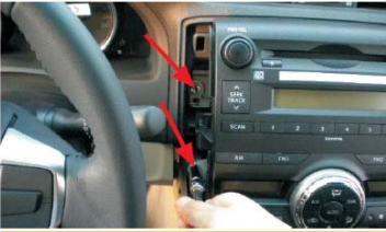
08 拆下左侧固定支架的两螺丝