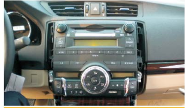
06 拆下后效果。拆下后把毛巾盖在档位手柄上以做保护