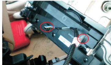
12 拔下空调盒线，注意取消白色扣子