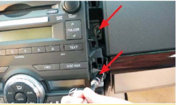
07 拆下右侧固定支架的两螺丝