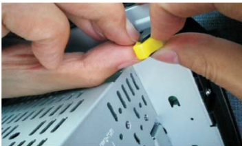
17 取下4个黄色扣子，装到DVD导航机