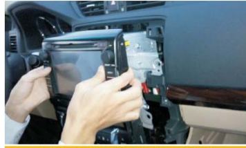
23 对接好空调盒线后把主机对好位，放好