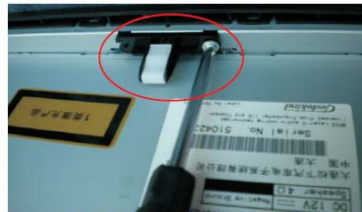
18 取下主机上部中间的定位块，装到DVD导航机上