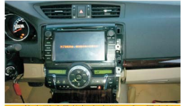
24 接电测试导航机和空调OK后，固定好4个螺丝