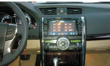
25 装上左/右两个装饰板后，即可享受视听新感觉了