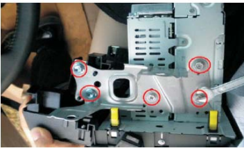
14 取下固定支架的螺丝