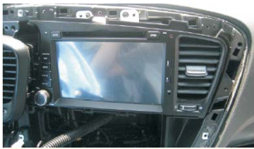
16 拆掉主机顶部的两颗机芯保护螺丝，将起亚K5专用机推入原车CD主机固定位，通电测试主机