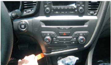
07 按图中所示撬起并取下中控台上的装饰条