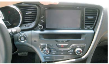
17 打上螺丝固定主机并参照拆机步骤依次装好空调控制面板、仪表盘、仪表盘左侧的小装饰条、方向盘下盖板、方向盘左侧盖板以及中控台装饰条