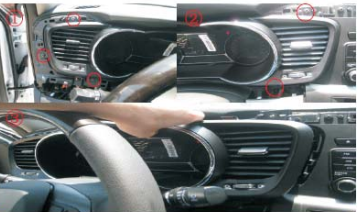
08 取下仪表盘左右两侧5颗螺丝，再向外拉出仪表盘（拉出少许就可以了，不需取下）