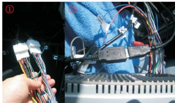
14 将起亚K5专用机所配的专用线材与原车插头对接，并将专用线上的USB头与专用机尾部USB座连接