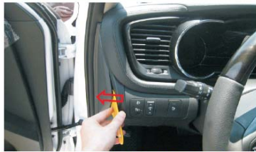
04 按箭头所示方向撬起并取下方向盘左侧的盖板