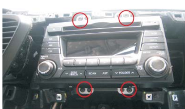
11 下原车CD的四颗固定螺丝