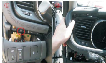
06 取下图中所示螺丝，再取下仪表盘左侧的小装饰条