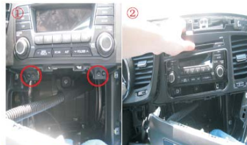
10 取下原车CD面板下面的两颗固定螺丝，再取下原车CD面板