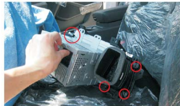
13 拆下原车CD面板上的出风口和面板固定扣，并将其装在起亚K5专用导航仪表盘上