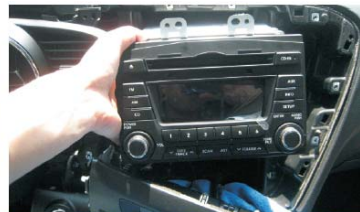
12 双手向外用力取出原车CD主机，拔出原车CD主机机尾线