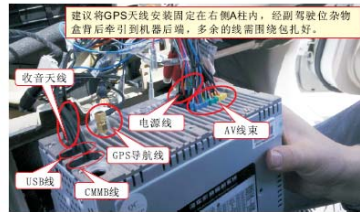
15 连接导航、收音天线；连接主机电源、音响连接线及AV线束