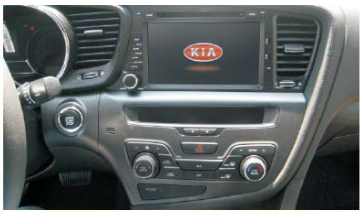
18 起亚K5专用机安装后的效果图