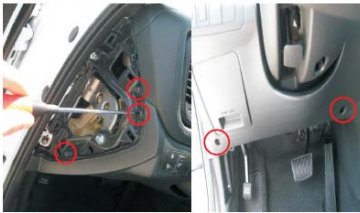
05 取下左侧所示三颗螺丝以及方向盘下盖板上的两颗螺丝；再取下方向盘下盖板