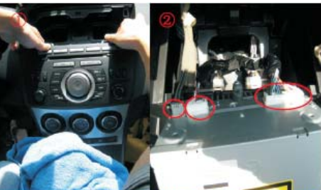
07 双手向外用力取出原车CD主机，拔出原车CD主机机尾线