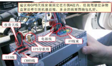
10 连接导航、收音天线；连接主机电源、音响连接线及AV线束