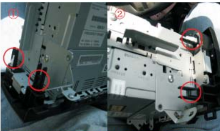
08 拆下原车CD左右共四个固定扣，并将其装在新马三专用导航仪表盘上