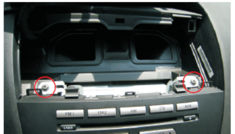
06 取下图中所示两颗螺丝