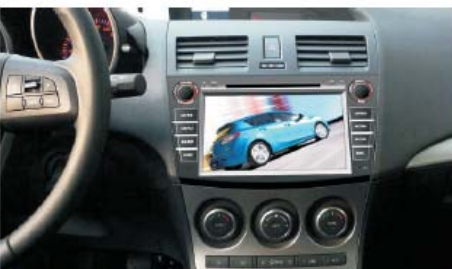
13 新马三专用机安装后的效果图