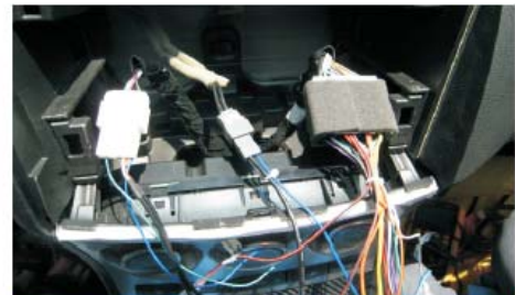
09 将新马三专用机所配的专用线材与原车插头对接，并将专用线上的USB线引到副驾驶位储物箱