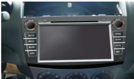
11 拆掉主机顶部的两颗机芯保护螺丝，将新马三专用机推入原车CD主机固定位，通电测试主机