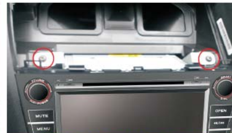
12 打上螺丝固定主机并装上空调出风口面板