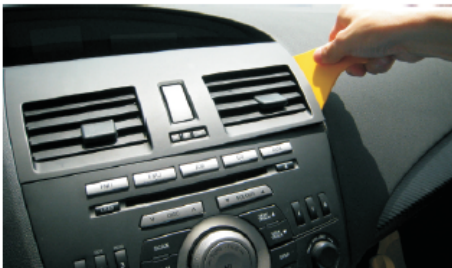
04 用胶刀如图所示撬松空调出风口面板