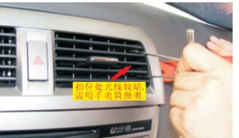
15 用薄刀插进空调出风口右侧缝隙,然后用两把小点的螺丝批伸进空调出风口的格子里面,往出风口中间撬松扣位,然后薄刀用力把出风口右侧撬起(此步操作需用手电筒照明)