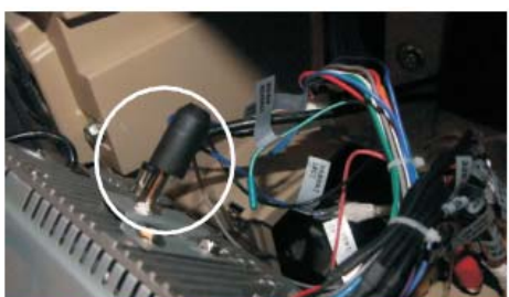
21 取下原车CD机后面的固定尾锥,装到本公司DVD导航主机尾部