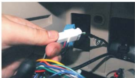
23 将DVD导航主机电源尾线上的方孔插头和原车预留的方控线接好(白色)