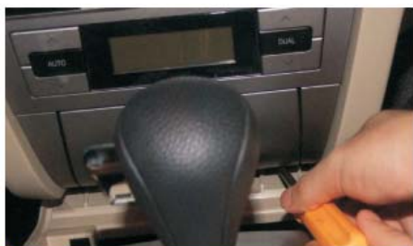
28 装点烟器面板并打下面的两个固定螺丝