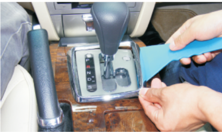
04 用薄胶刀撬起档把周围的电镀圈