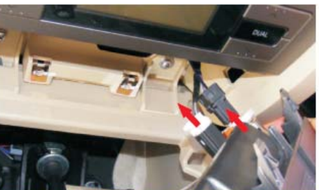
11 拔掉点烟器面板后面的2个插头,取出点烟器面板