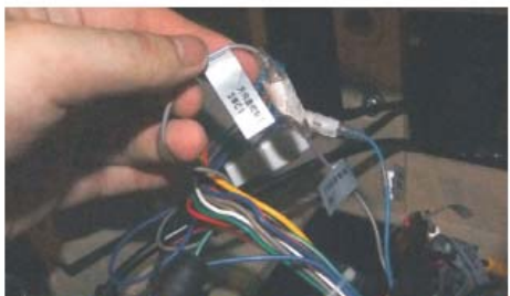
24 将DVD导航主机电源尾线上的方控线1方控线2和AUX线束上的方控线1方控线2接好,然后插上收音天线