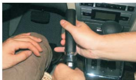
32 装上档把上的套筒