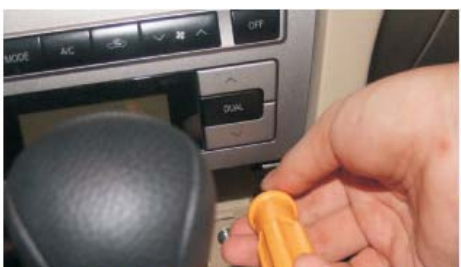
27 把空调控制面板装进位置,打上空调控制面板下面的两个固定螺丝