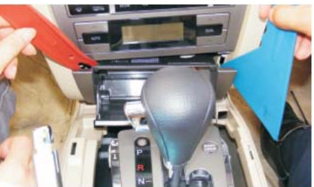
10 左右一起撬点烟器面板