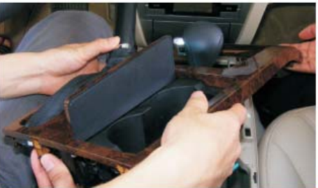
08 以档把为中心顺时针旋转水转印面板大约45° 此时可取出水转印面板