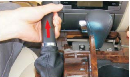
07 把档把上的套筒脱出到不能脱出为止 (注意不要把蒙皮弄破)