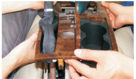
06 提起水转印面板到一定角度