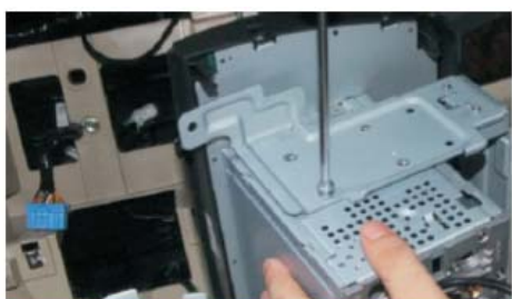
20 取下原车CD机的左右装车支架,然后装在本公司DVD导航主机上