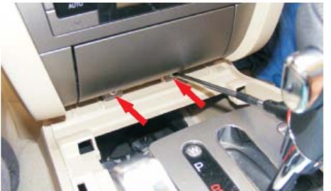
09 用十字批取出点烟器下面的两颗螺丝