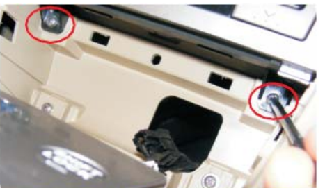
12 取出空调控制面板下方的固定空调控制面板的两颗螺丝