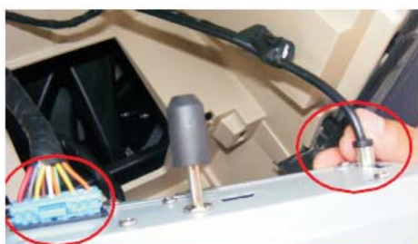
19 用力取出CD面板,然后拔掉CD机后面的收音天线插头和原车电源插头