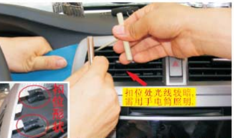
14 用薄刀插进空调出风口左侧缝隙,然后用两把小点的螺丝批伸进空调出风口的格子里面,往出风口中间撬松扣位,然后薄刀用力把出风口左侧撬起(此步操作需用手电筒照明)