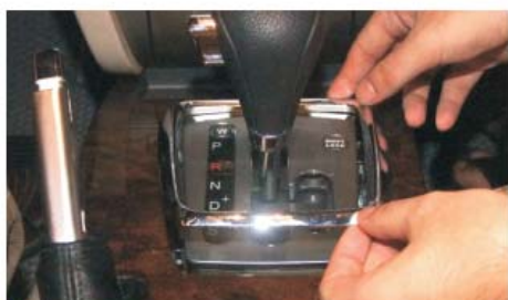
31 装上档把周围的电镀圈