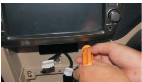
25 装上本公司DVD导航主机,并打上固定的4颗螺丝