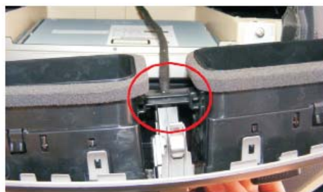
29 接上双跳灯插头,装回空调出风口面板