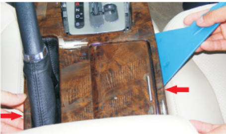
05 分别从左右撬松档把水转印面板