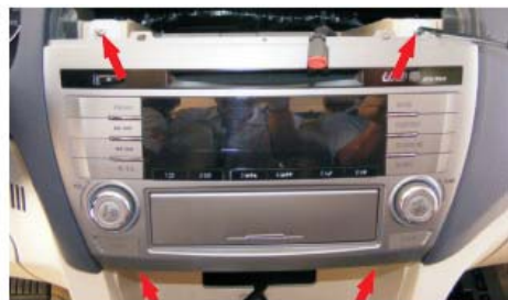
18 拆固定CD面板的4颗螺丝