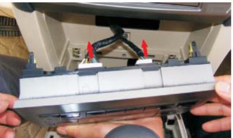
13 双手托起空调控制面板并用力拉出来,再去掉后面的2个插头